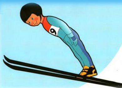
Прыжки на лыжах с трамплина